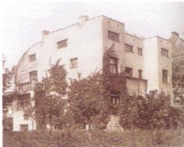
الشكل (2) مسكن شتاينر للمعماري (Loos)