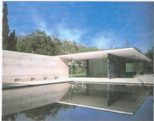
الشكل (4) معرض برشلونة للمعماري (Mies)